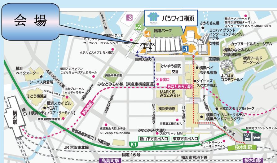
(会場：パシフィコ横浜 アネックスホール)