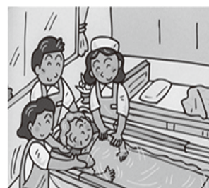
自宅ベッドの横で入浴が可能にしました

1972年に世界で初めて移動入浴車を製造販売。訪問入浴介護は、介護保険制度における在宅サービスの一つとして全国的に普及を果たしました。 デベロは、さらなる挑戦として、広い分野から技術・情報を取り入れた製品づくりを目指しております。