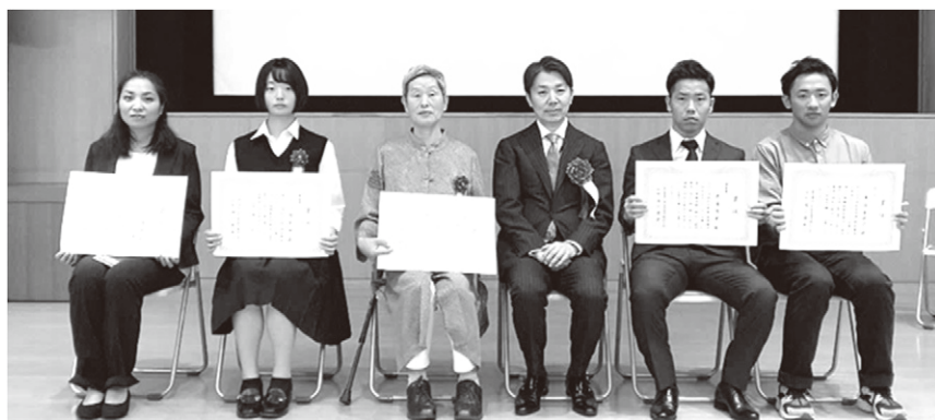
受賞者（1名欠席）と浅川会長