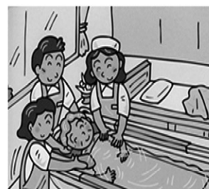
自宅ベッドの横で入浴を可能にしました

1972年に世界で初めて移動入浴車を製造販売。訪問入浴介護は、介護保険制度における在宅サービスの一つとして全国的に普及を果たしました。 デベロは、さらなる挑戦として、広い分野から技術・情報を取り入れた製品づくりを目指しております。