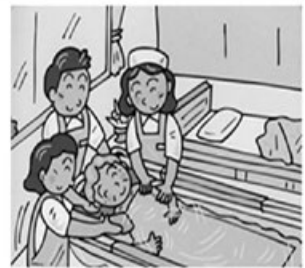
自宅ベッドの横で入浴を可能にしました

デベロは、さらなる挑戦として、広い分野から技術・情報を取り入れた製品づくりを目指しております。