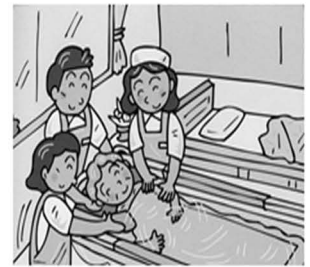
自宅ベッドの横で入浴を可能にしました

デベロは、さらなる挑戦として、広い分野から技術・情報を取り入れた製品づくりを目指しております。