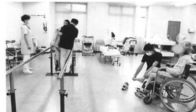
▲リハビリテーション風景▲