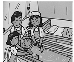
自宅ベッドの横で入浴を可能にしました

1972年に世界で初めて移動入浴車を製造販売。訪問入浴介護は、介護保険制度における在宅サービスの一つとして全国的に普及を果たしました。 デベロは、さらなる挑戦として、広い分野から技術・情報を取り入れた製品づくりを目指しております。