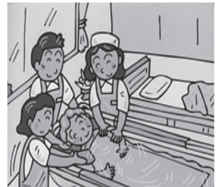
自宅ベッドの横で入浴を可能にしました

デベロは、さらなる挑戦として、広い分野から技術・情報を取り入れた製品づくりを目指しております。