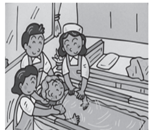
自宅ベッドの横で入浴を可能にしました

デベロは、さらなる挑戦として、広い分野から技術・情報を取り入れた製品づくりを目指しております。